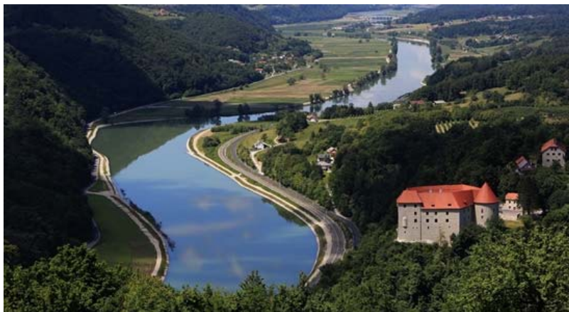
(mekšrK irp avaS aker)