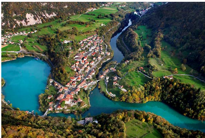
(ičoS an utsoM irp ačoS aker)