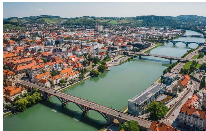
(robiraM izoks avarD aker)